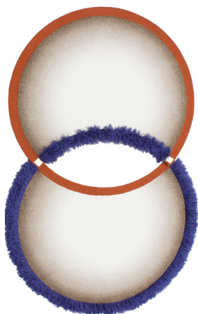
Issho - Composizione 1